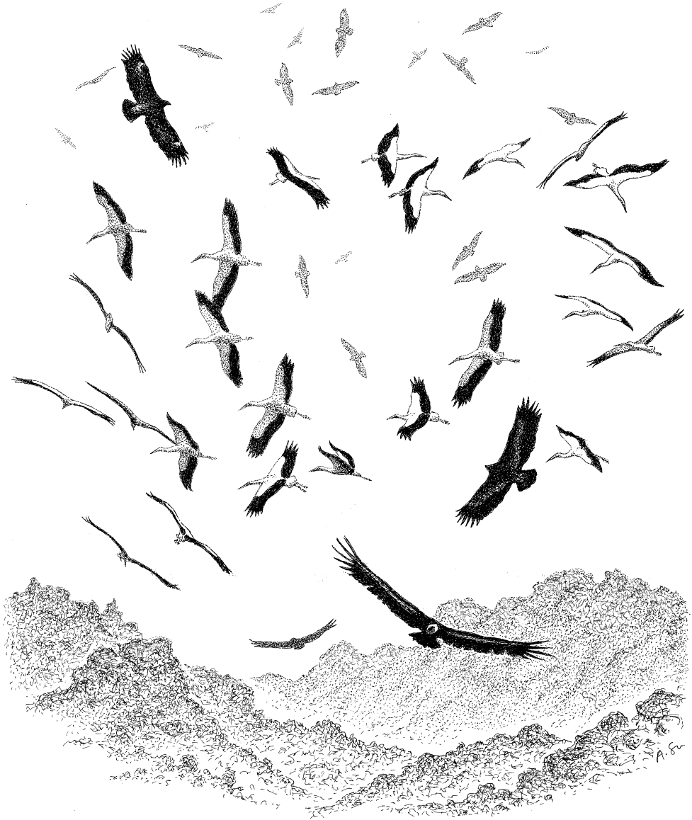
Kreisende Störche auf dem Heimzug aus Afrika über dem Sinai, begleitet von einem Schreiadler (links oben), einem Steppenadler (rechts unten) und, darüber, von zahllosen Falkenbussarden. Dazu gesellen sich Gänsegeier, die hier beheimatet sind (unten). – Zeichnung: Andreas Suchantke.