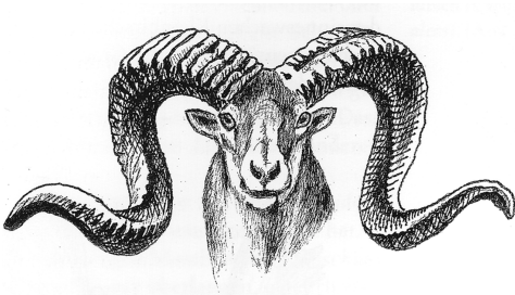
Gehörn des Pamir-Wildschafes (Ovis ammon polii).

Abschließend untersucht Suchantke die »Vergliedmaßung« im Kopfbereich in Form von Hörnern und Geweihen bei den Säugetieren. Diese auch noch in den den Text begleitenden Zeichnungen eindrucklichen und vielfach polaren Gebilde stellt er in ein Verhältnis zum jeweiligen Gesamtorganismus und erfasst diesen so noch einmal ganz neu in seiner spezifischen Wesenheit. Schließlich: Das, was sich bei den tierischen Organismen vielfach durchdringt und in ihrem Verhältnis zur Umwelt festlegt, entmischt sich beim Menschen: Durch die Aufrichtung wird nicht nur z.B. der Kopf von allen Gliedmaßenfunktionen weitestgehend befreit, sondern es bleibt den einzelnen Organsystemen zeitlebens eine relative Unspezifität erhalten. Diese »Unfertigkeit« insbesondere der Gliedmaßen setzt »ein Bewusstsein voraus, dass sich dieser offenen, präge- und lernbereiten Organe bedient« (S. 292). Dem entspricht ganz die durch die neuen Hominidenfunde sich bestätigende Tatsache, »dass die physische Menschwerdung nicht vom Kopf, sondern von den Füßen her begann«. Der aufrechte Gang ist bereits da, bevor der Schädel tatsächlich menschenähnliche Proportionen erreicht hat. Er ist die Voraussetzung für die Entmischung der Systeme, durch die die Organe belehrbar werden. Nun erst setzt die Vergrößerung des Gehirns ein und erhält der hintere Schädel seine charakteristische sphärische Gestalt.