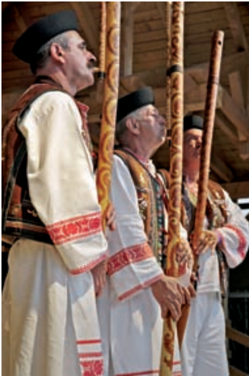
Oben: Fujara-Trio aus Kokava

Links: Hochweide auf dem nördlichen Pol'anamassiv.